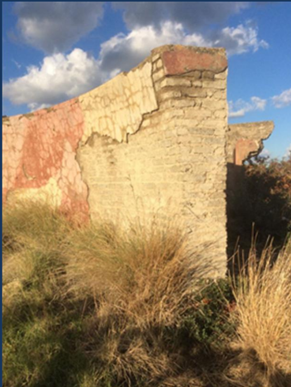
Particolari strutturali e della del Muro d'Ascolto

L'ispezione visiva del manufatto ha rivelato particolari inediti della sua costruzione come l'impiego di mattoni di calcestruzzo invece dei soliti conci ed abbondanti tracce della verniciatura mimetica originaria.