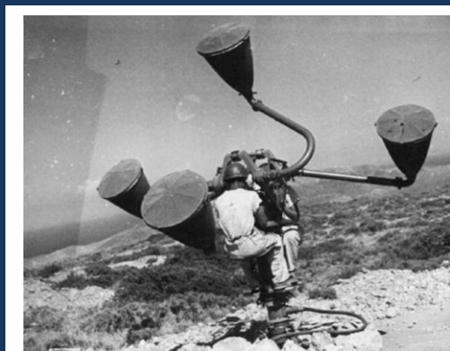
Aerofono Modello OG/41

Ciò che rende unico il Muro d'ascolto di S. Placido non è soltanto la sua esistenza (da quanto si sa è l'unico in Italia), ma il fatto di essere inserito in un sito destinato all'addestramento dei militi della DICAT comprendente altri manufatti peculiari come due tane d'ascolto ed una grande vasca in cemento destinata ad ospitare un aerofono OG 41. Nel sito sono presenti anche delle piazzole di cemento che forse ospitavano alcuni cannoni antiaerei ed una specie di podio centrale con scalette, probabilmente usato per il Direttore Didattico o per la centrale aerofonica.