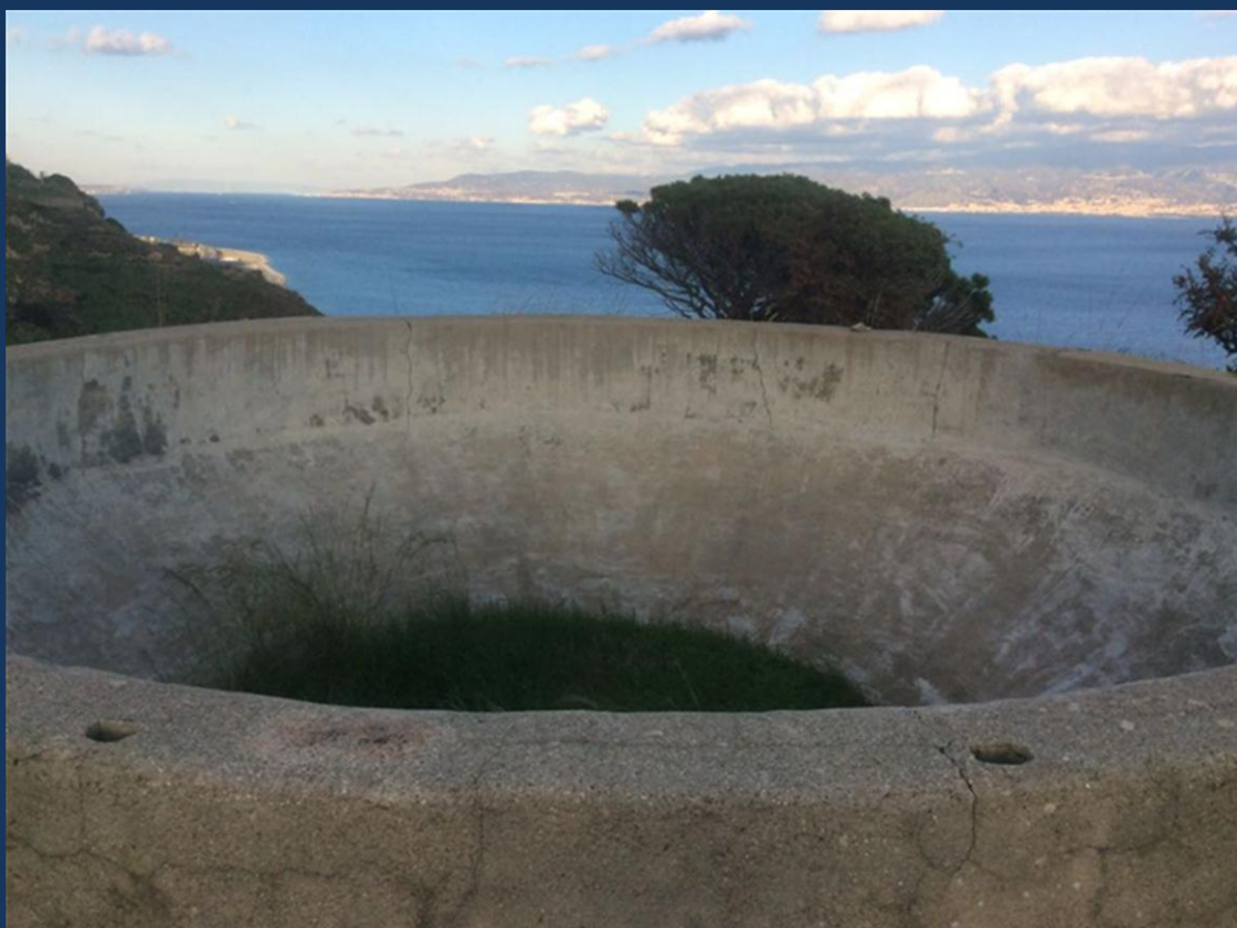
Figura 1 La postazione aerofonica