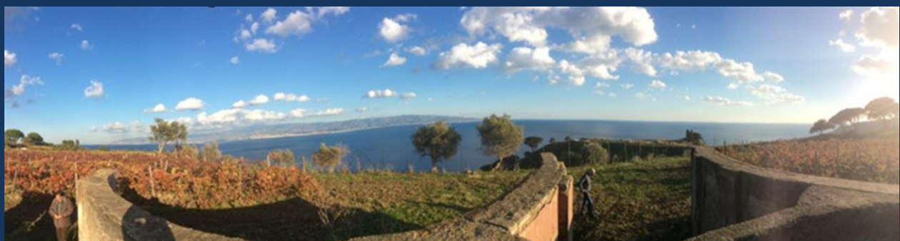
Foto panoramica dal Muro d'Ascolto verso la costa calabra

Pertanto, mentre in Inghilterra la costruzione di Muri d'Ascolto e riflettori parabolici acustici in prossimità delle coste sulla Manica veniva abbandonata in favore del radar, in Italia si continuò a studiare e sviluppare sia "l'aerofono" che il "muro d'ascolto – tane d'ascolto". In particolare fu sviluppato il muro d'ascolto parabolico sia lineare a un settore, che quello