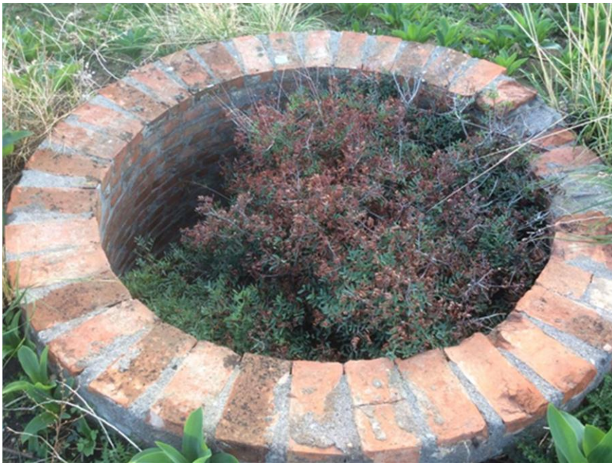
Una delle due tane d'ascolto